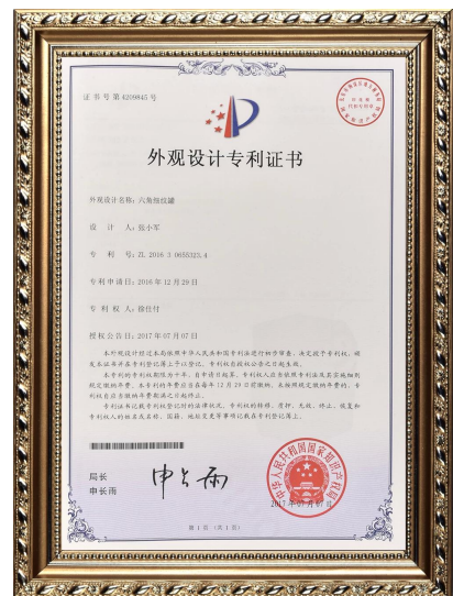
Патент №: 20163065532.4