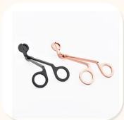
Wick Trimmer Cutter