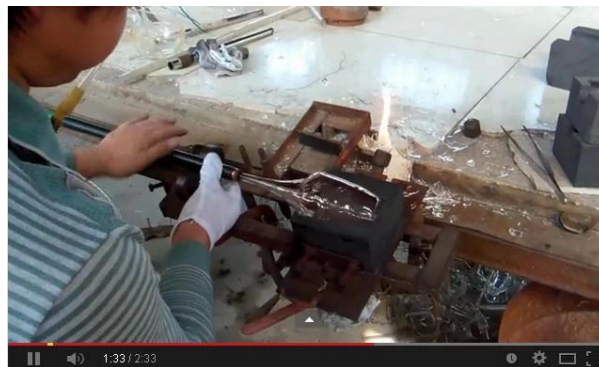
Техника ручного выдувания