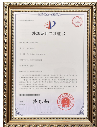
Патент №: 201630655323.4