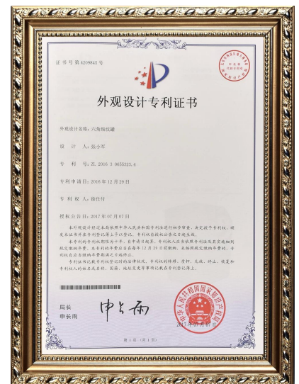
Патент №: 201630655323.4