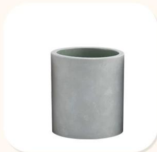
Cement Candle jar