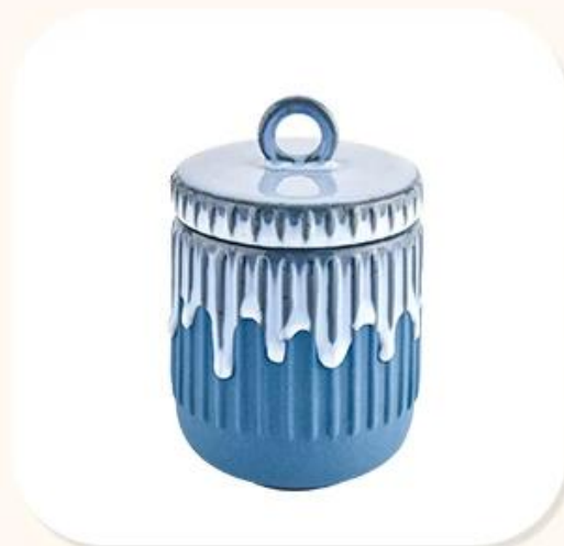
Ceramic Candle jar