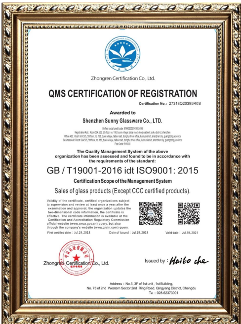
ISO 9001: 2015