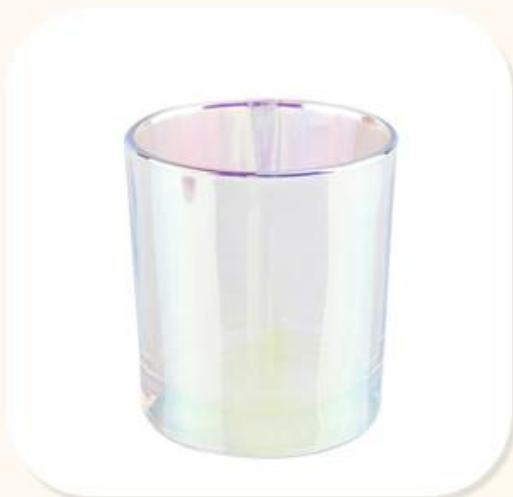
Glass Candle Vessel