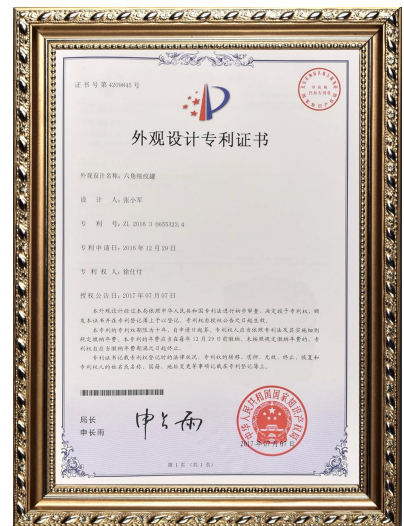
Патент №: 201630655323.4