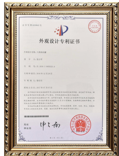
Номер патента: 201630655323.4.