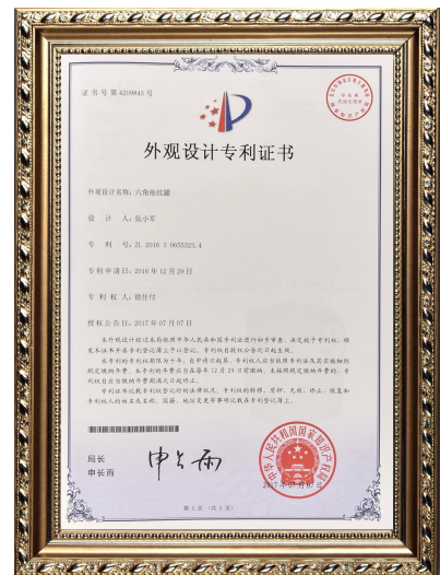
Патентный номер: 201630655323.4