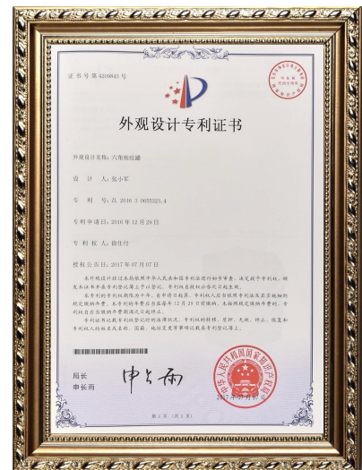
Патентный номер: 201630655323.4