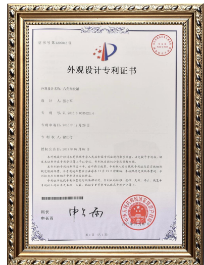
Patente no.: 20163065523.4