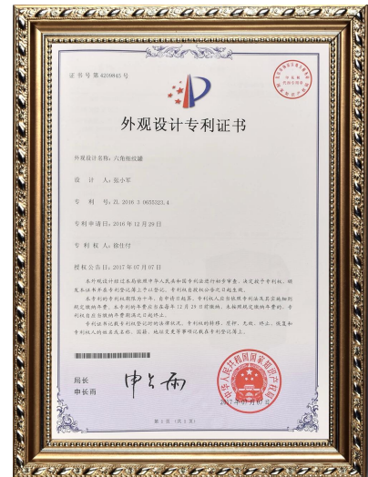
Patente no.: 201630655323.4