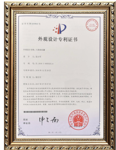
Nº da patente: 201630655323.4