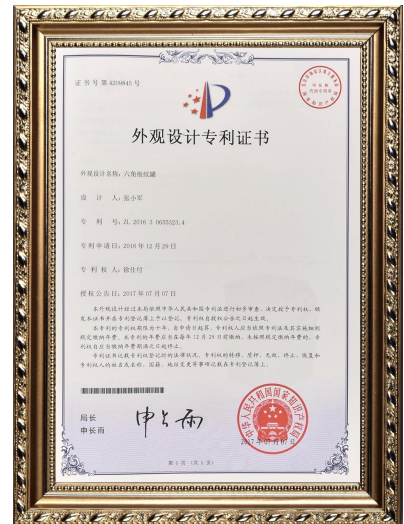
A patente n. : 201.630.655.323,4