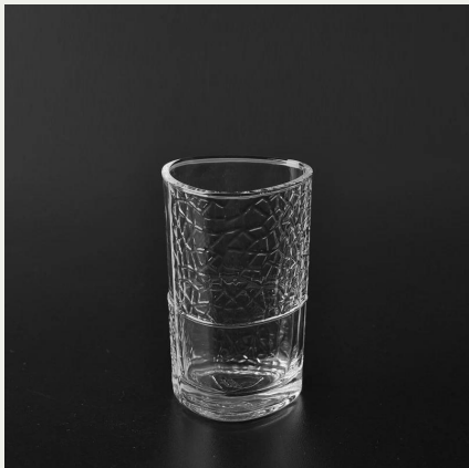
vidro de tiro