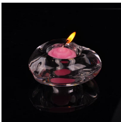
coração castiçais forma de vidro