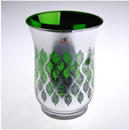
Detentor de árvore verde de vela de vidro