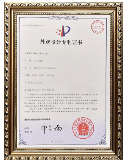
Patente n.º: 201630655323.4