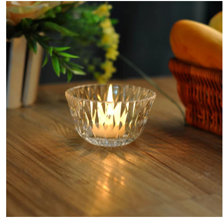
suporte de vela tealight wholesale