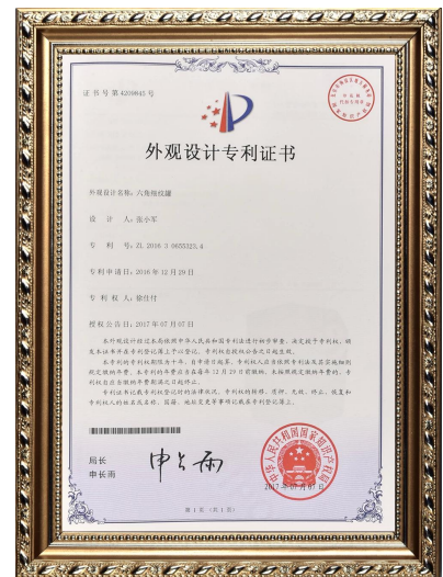
Nº da patente: 20163065532.4