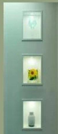
Show de fábrica: