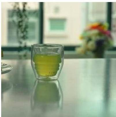
Xícara de café de Pyrex