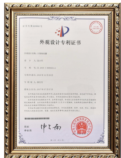
Patente no. : 201630655323.4