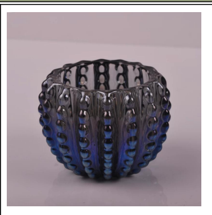
castiçais listra do ponto de vidro