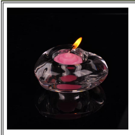
coração castiçais forma de vidro