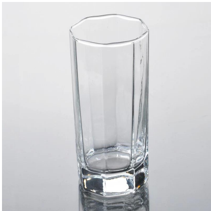
11,3 onças máquina soprado copo de vidro