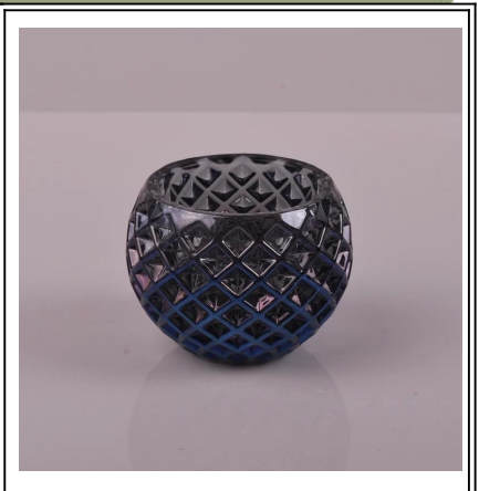
castiçais de vidro padrão de tecido