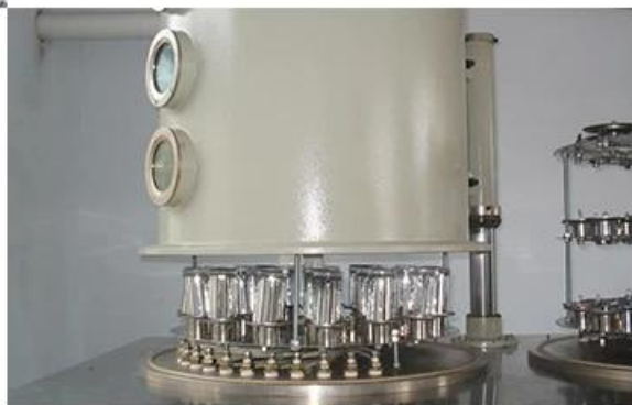
04 VACUUM ELECTROPLATING