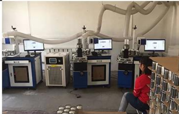
02 LASER ENGRAVING