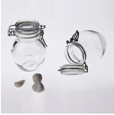
jarra de vidro