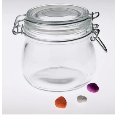
armazenamento de vidro personalizado