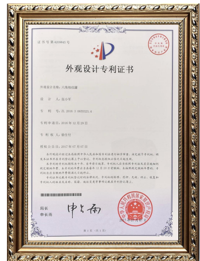
Nº da patente: 201630655323.4