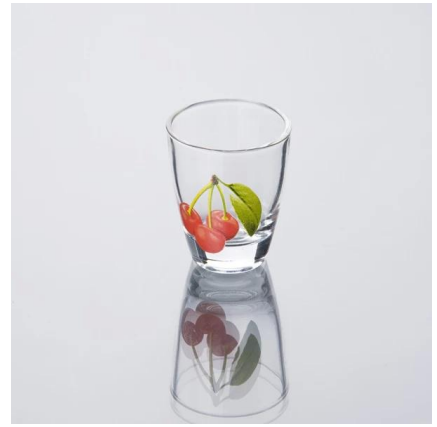
impressão vidro de tiro