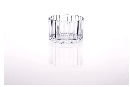
claro castiçal de vidro