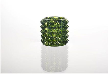
colored vela copo de vidro