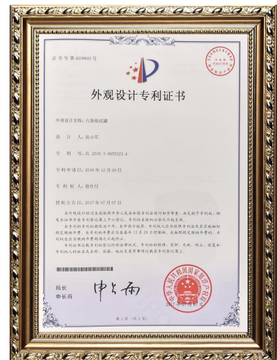
Patente no.: 201630655323.4