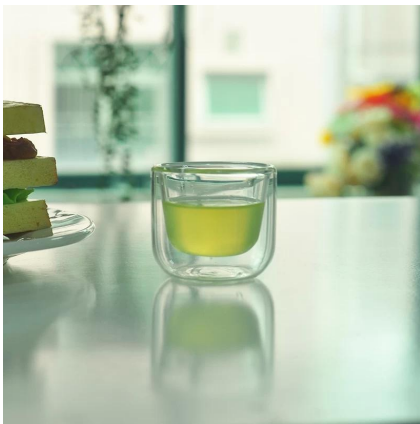
forma de cilindro claro parede dupla de borosilicato tumbler