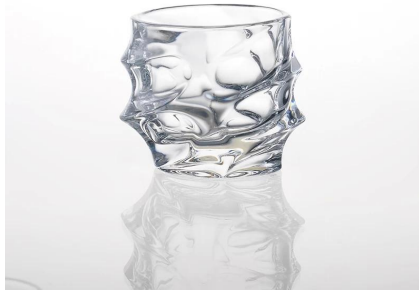
vela decoração de vidro suporte