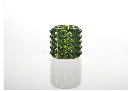
colored vela copo de vidro

S Our Company & Sample Room Every day is sunny day