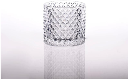
vela de vidro significa casamentos