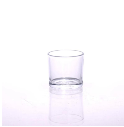
máquina feita de suporte de vela de vidro