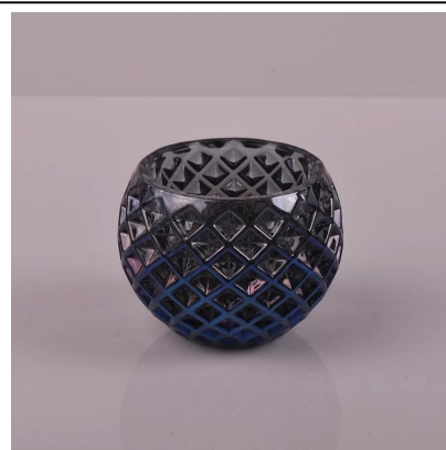
castiçais de vidro padrão de tecido