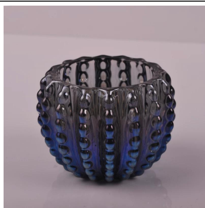
castiçais listra do ponto de vidro