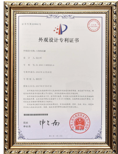
Patente no. : 201630655323.4