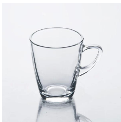
caneca de vidro branco do hight