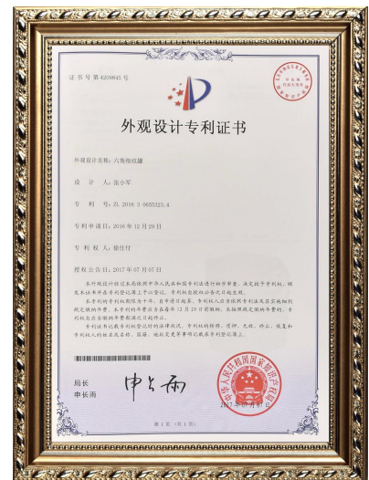
Patente no. : 201630655323.4