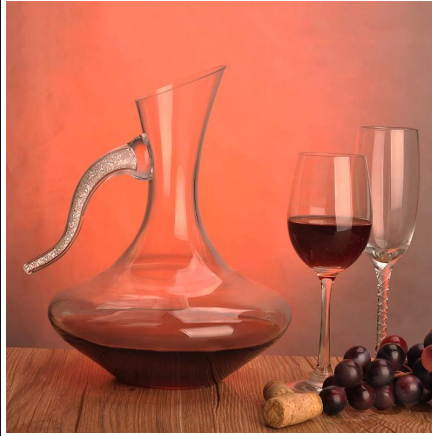
Atacado de decantador de vinho de vidro em massa