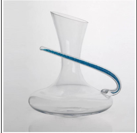
Vinho de cristal atacado vidro Whisky Decanter