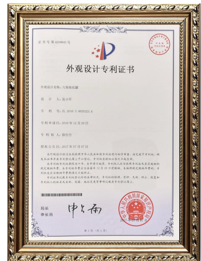
A patente n. : 201.630.655.323,4