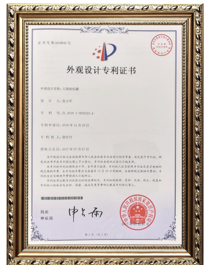
A patente n. : 201.630.655.323,4