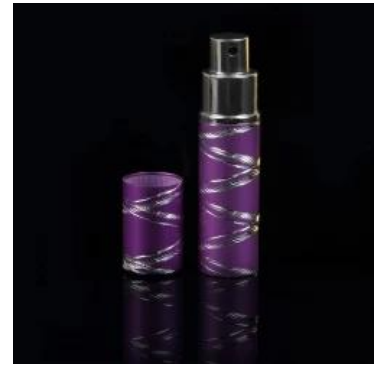
roxo cor frasco de perfume de vidro