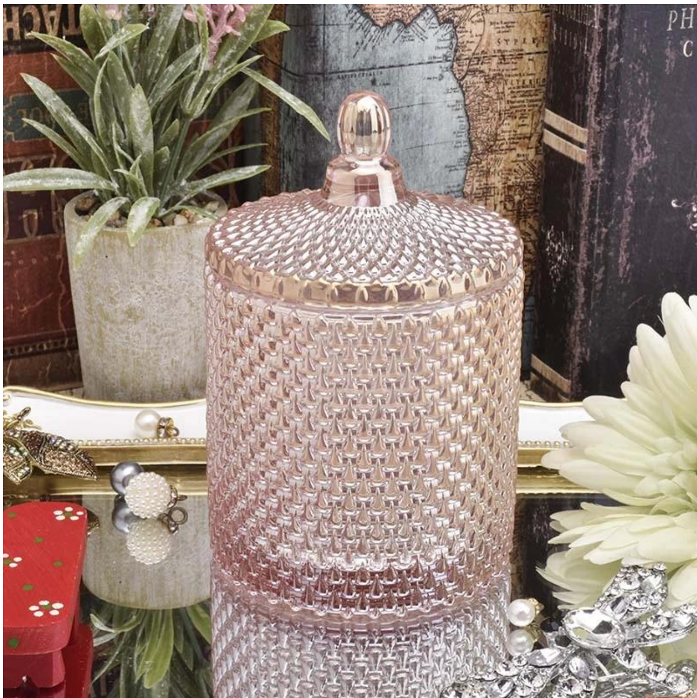
Range of the application