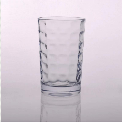
granel novo copo de design