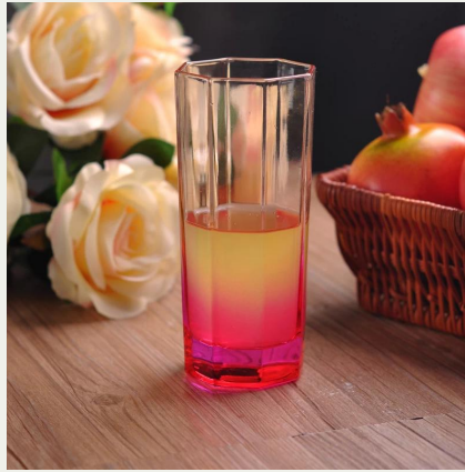
fabricantes de vinho de vidro beber china