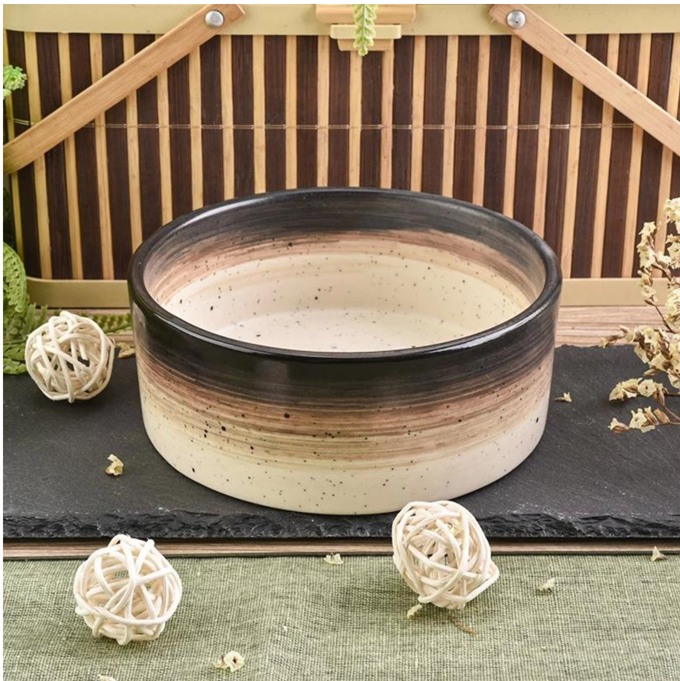
Acessórios para tampas de vela: