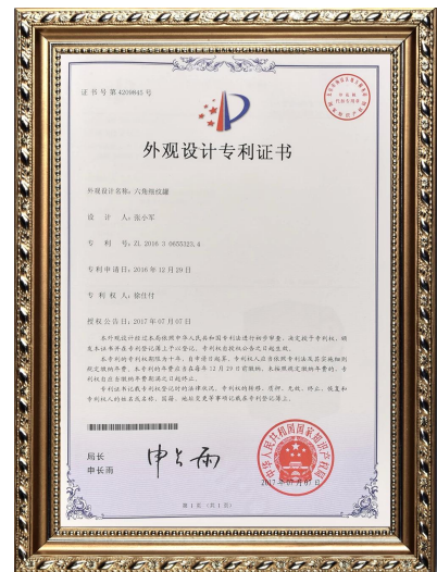
Número da patente: 201630655323.4