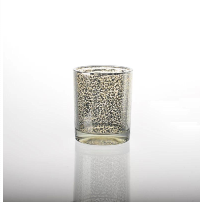
Suporte de vela pulverizado