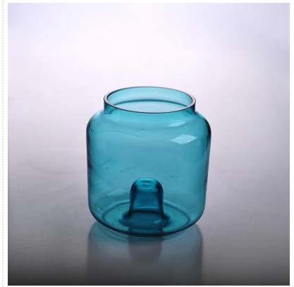
Suporte de vela de vidro handmade chegada nova