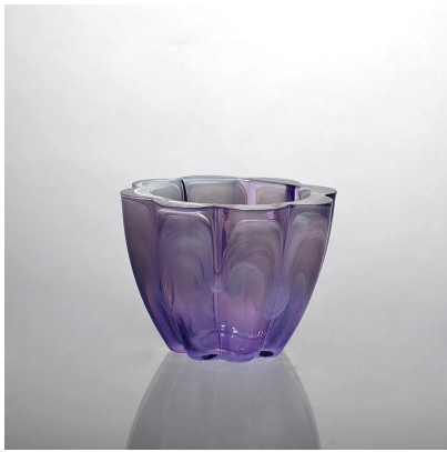
Suporte de vela de pintura de cor