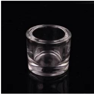
Suporte de vela tealight cilindro