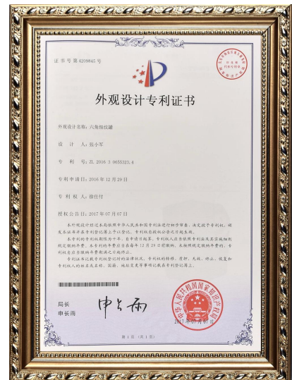
Patente no .: 201630655323.4